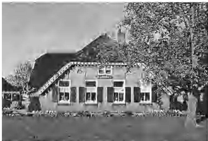
Baerfeldt 'De Lichtenburg'