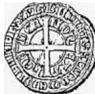
keerzijde (ware grootte)