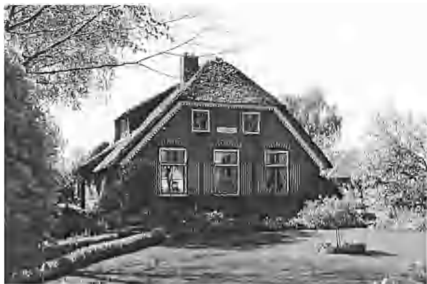
Baerfeldt 'F. Louw'