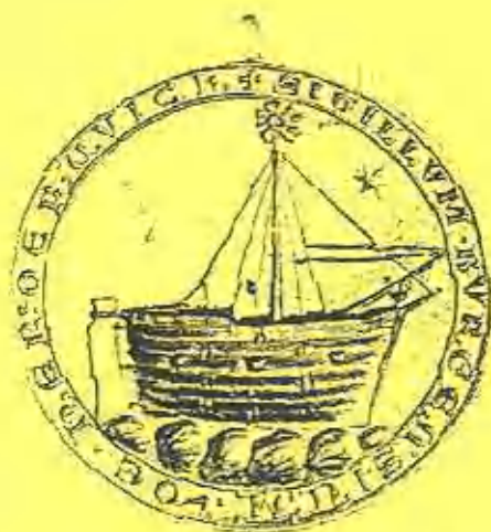
Zegel van de kooplieden van Harderwijk uit 1263. Randschrift: "sigillum burgensium de harderwiche"