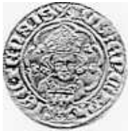
Voorzijde (ware grootte)