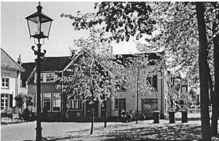
Vischmarkt anno 2001.

Vraag: wie weet wat het gebouw is, op het schilderij van Springer, dat hoog boven de huizen aan de Rechte- of Grote Oosterwijk uitsteekt?