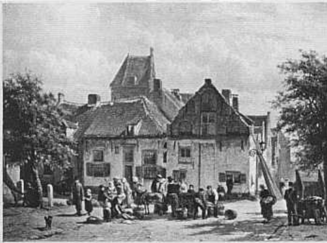
Vischmarkt anno 1864 op een schilderij van C. Springer.

De Vischmarkt was ooit gewoon “de Markt” waar op vaste plaatsen gehandeld werd. Die plekken kregen dan de naam van het verhandelde product. De Schapenhoek heeft er zijn naam aan te danken. Het achterste deel van “De Markt” heette “Korenmarkt”. Het voorste deel, bij de Vischpoort was de plek voor het verhandelen van zeevis, nadat die handel uit de Bruggestraat was verdwenen.