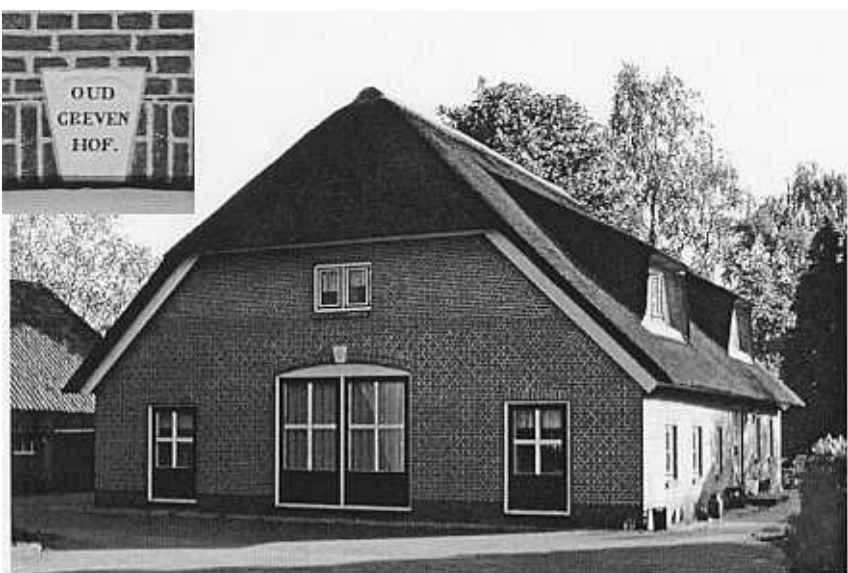
Erf Oud Grevenhof.