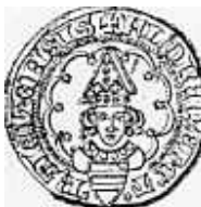
voorzijde (ware grootte)