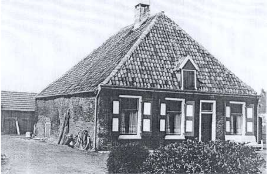
Boerderij "De Rode Haan" (gesloopt begin jaren '70)

Deze naam kan omstreeks 1870 nog hebben "rondgezworven", maar ook de vele schoorsteenbrandjes kunnen aanleiding zijn geweest voor een nieuwe "Rode Haan" aldus Van het Loo.