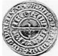
keerzijde (ware grootte)