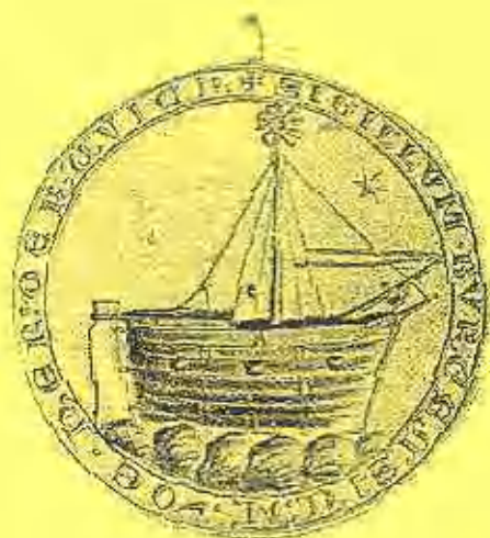
Zegel van de kooplieden van Harderwijk uit 1383. Randschrift: "sigillum burgensium de harderwiche"