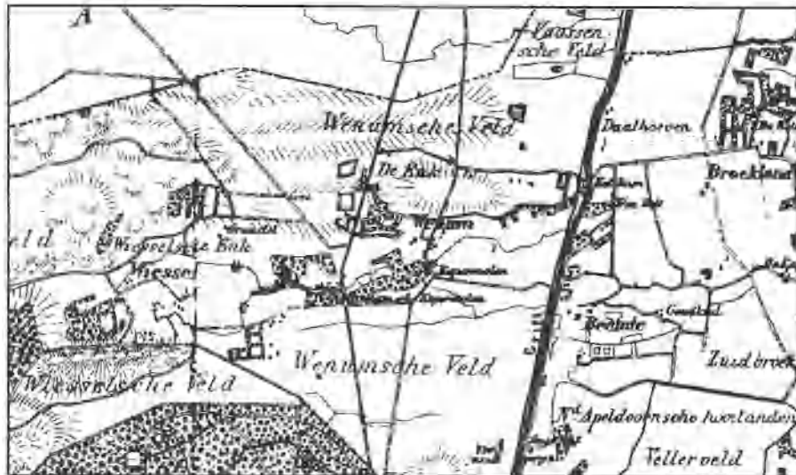
Buurschap op de Middel-Veluwe, prov. Gelderland, distr. Veluwe, arr. en 7 uur gaans van Arnhem, kanton gemeente en ½ uur gaans van Apeldoorn, met 45 huizen en 270 inwoners. Uit de gemeentatlas Gelderland van 1868.