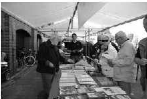
Vrijwilligers van Herderewich bemensen een kraam tijdens één van de vele culturele manifestaties in Harderwijk, Hierden en Ermelo

dankzij de inzet van de vele vrijwilligers, met beperkte financiële middelen. Herderewich gaat mee met haar tijd. Zo is er een uitgebreide website, een pagina op Facebook en kun je Herderewich tegenwoordig volgen op Twitter. We kunnen niet alles alleen en werken daarom graag samen met andere organisaties, zoals het Gilde van Stadsgidsen, de Botterstichting, Oudheidkundige Vereniging Ermeloo, de Bibliotheek en allen die onze doelen onderschrijven. Dat hoeft niet in ingewikkelde overeenkomsten, maar dat kan op basis van eenvoudige afspraken. Herderewich heeft inmiddels ruim meer dan 700 leden en wil groeien naar 1.000. Voor een stad met meer dan 40.000 inwoners moet dat haalbaar zijn. Wel moet het aantal actieve vrijwilligers meegroeien, mensen die een of meerdere taken op zich willen nemen of die zitting willen nemen in een van de werkgroepen. Er is veel werk te doen op het gebied van genealogie en archiefonderzoek. Ook schrijvers van historische verhalen zijn welkom.