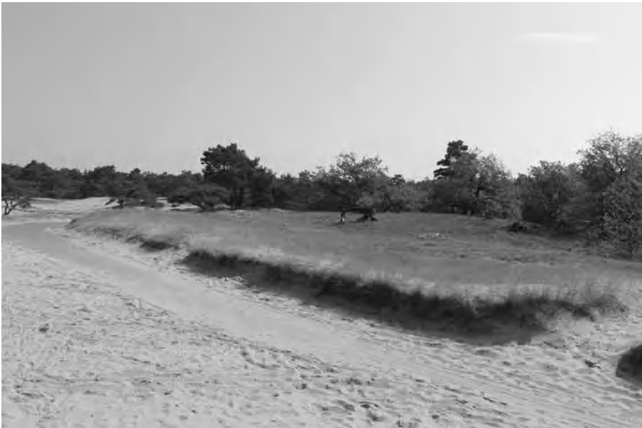
De fietstocht gaat o.a. over het Beekhuizerzand

Speciaal voor Open Monumentendag heeft Herderewich een fietstocht samengesteld rond het thema 'Groen van Toen'. Start en eindpunt van de fietstocht, met een lengte van ongeveer 25 kilometer, is Molen de Hoop aan de Havendijk. De fietstocht is op eigen gelegenheid te maken en een gedetailleerde routebeschrijving is beschikbaar bij de Molen. De tocht voert o.a. langs twee begraafplaatsen, Oostergaarde en de Joodse begraafplaats. Juist omdat dit oases van groen zijn. Daarnaast voert de fietstocht via Hierden naar Station Hulshorst en via het Beekhuizerzand terug naar Harderwijk. Juist deze tocht voert langs 'historische, groene' plaatsen die onze gemeente rijk is en laat zien hoe gevarieerd de gemeente Harderwijk is. De afstand is voor iedereen te doen en hoeft dus geen beletsel te zijn om de tocht te maken. De fietstocht is ook te vinden op internet via de website www.herderewich.nl Pak de fiets op Open Monumentendag en ontdek hoe mooi het groen van toen ook nu nog is.