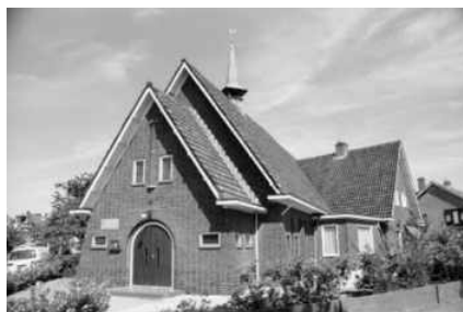
Het gebouw van de Nederlandse Protestanten Bond aan de Verkeersweg