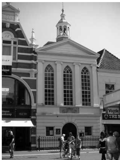
De lutherse kerk in Amersfoort (Archief Eemland, foto Dick Velthuizen).

Haar opvolger ds. Gerard Fafié start de kring weer najaar 1969; de naam ervan verandert geregeld maar het enthousiasme blijft. Elke paar maanden komt men samen en soms ook vaker. De diensten in Harderwijk worden nu gecombineerd met de NPB, enkele malen per jaar. Doordat de synode in 1970 Ermelo en Putten bij Amersfoort indeelt wordt de groep lutheranen op de Veluwe nog groter.