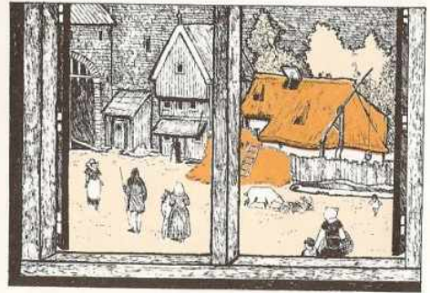
Een boerderijtje in de middeleeuwse stad.

We zien hier recht voor ons een voormalige stadsboerderij. In de stad woonden de zogenaamde stadsboeren. Hun boerderij stond vaak op of vlakbij een brink, een onbebouwd stuk grond in de stad, waar men kleinvee (varkens, schapen, geiten en kippen) hield. Het 'grote' vee (koeien en paarden) graasde op de stadsweiden buiten de ommuurde stad. Om toezicht te houden stelde het stadsbestuur