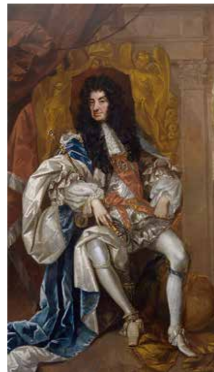
De Engelse koning Karel II rond 1680. Geschilderd door Thomas Hawker. Karel was een opportunist en was voor zowel Willem III als Lodewijk XIV een onbetrouwbare bondgenoot.