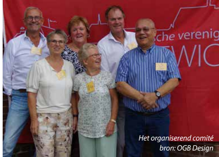
Het organiserend comité