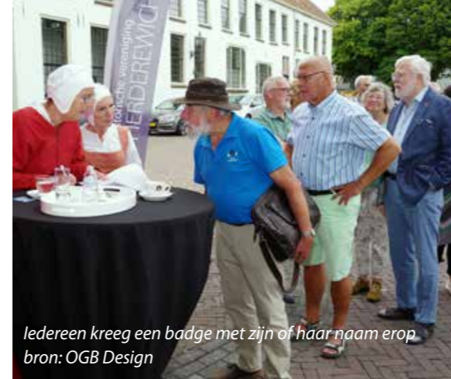
Iedereen kreeg een badge met zijn of haar naam erop