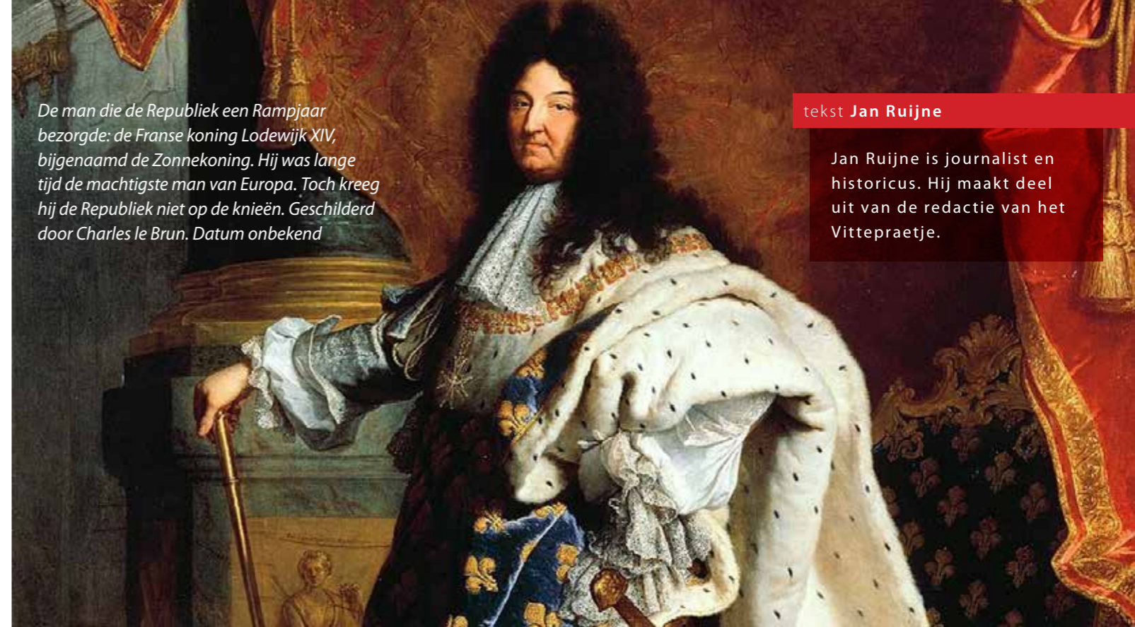
De man die de Republiek een Rampjaar bezorgde: de Franse koning Lodewijk XIV, bijgenaamd de Zonnekoning. Hij was lange tijd de machtigste man van Europa. Toch kreeg hij de Republiek niet op de knieën. Geschilderd door Charles le Brun. Datum onbekend