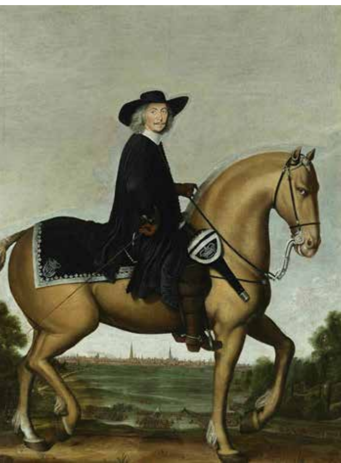
Bernard von Galen, bijgenaamd Bommen Berend, hoog te paard gezeten voor de poorten van Groningen. Het lukte hem niet Groningen in te nemen. Bernard was bisschop van Münster tijdens het Rampjaar en bondgenoot van de Zonnekoning. Geschilderd door Wolfgang Heimbach, 1674.