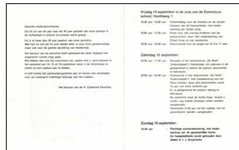
Feestprogramma viering 40 jaar priester