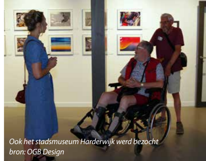
Ook het stadsmuseum Harderwijk werd bezocht