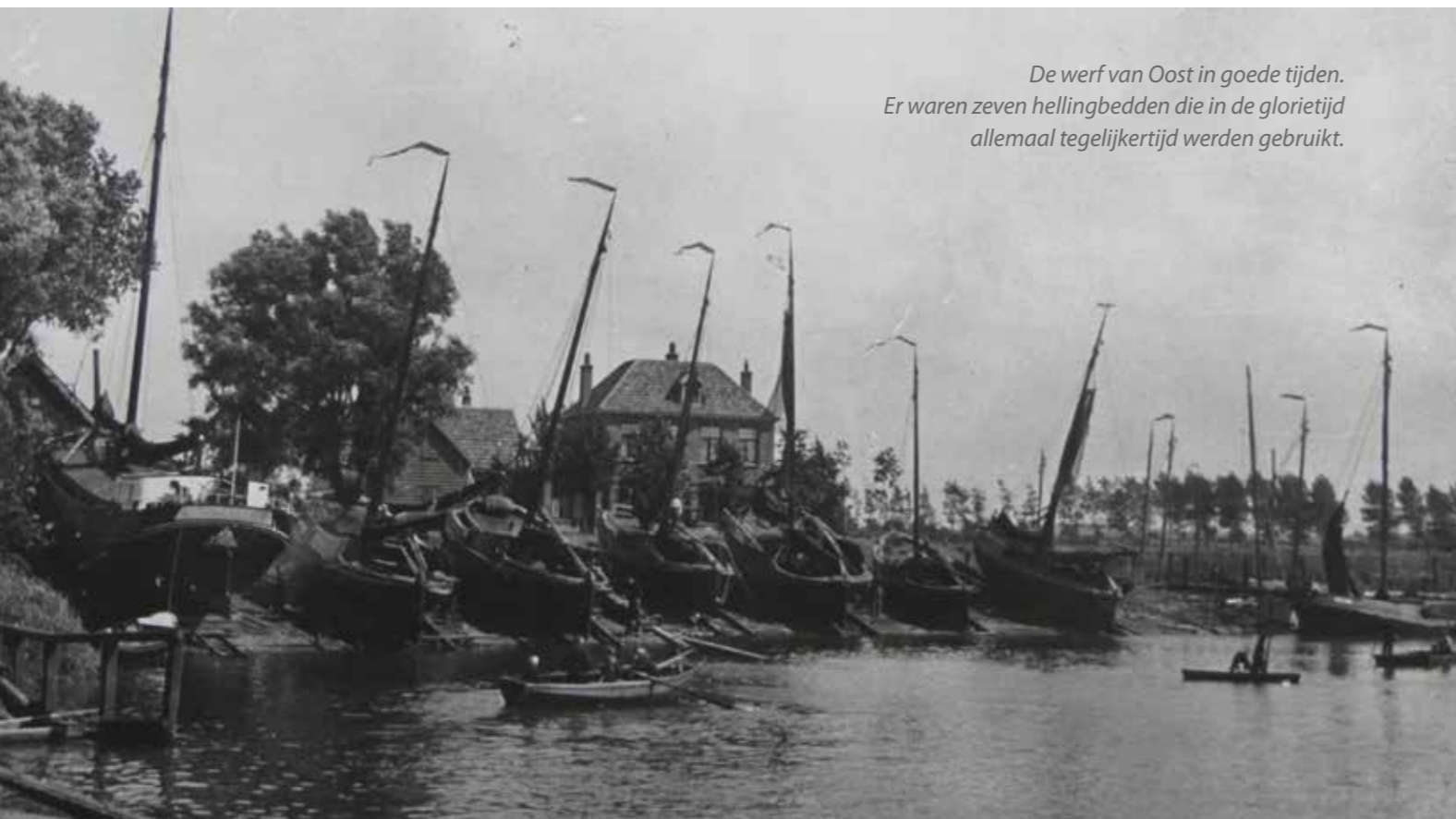
De werf van Oost in goede tijden. Er waren zeven hellingbedden die in de gloriejaren allemaal tegelijkertijd werden gebruikt.