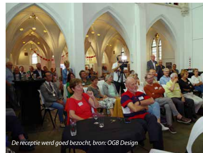
De receptie werd goed bezocht