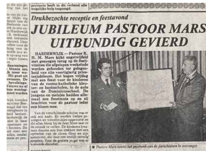
Schilders Nieuwsblad, 19 september 1979

De Catharinakapel was in de jaren '50 te klein geworden. De Harderwijkse bevolking groeide; er kwamen militairen naar de stad als ook mensen uit Nederlands-Indië, en mensen die bij de koekjesfabriek gingen werken. Een gymnastiekzaal in Tweelingstad werd gebruikt als