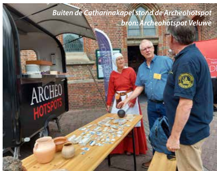
Buiten de Catharinakapel stond de Archeohotspot

Op vrijdag 26 augustus vierde Herderewich haar 50-jarig bestaan. Rond de honderd leden en introducés namen deel aan de diverse activiteiten die de vereniging mét de samenwerkende organisaties had georganiseerd. Het was een zeer succesvolle middag met voor iedereen wat wils. Het ontlokte een deelnemer bovenstaande uitspraak. Hieronder volgt een terugblik.