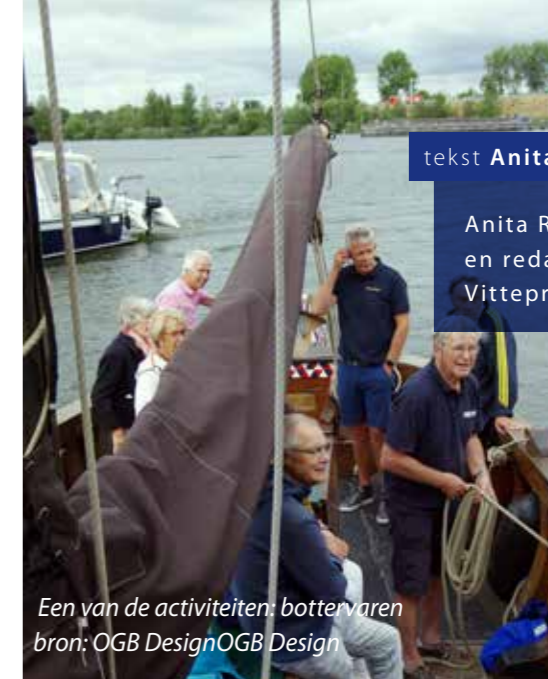
Een van de activiteiten: bottervaren