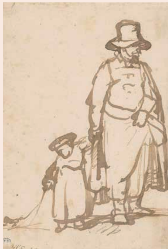
Rembrandt van Rijn (navolger van), Staande man met een kind aan de hand (1643), Rijksmuseum Amsterdam: RP-T-1961-79