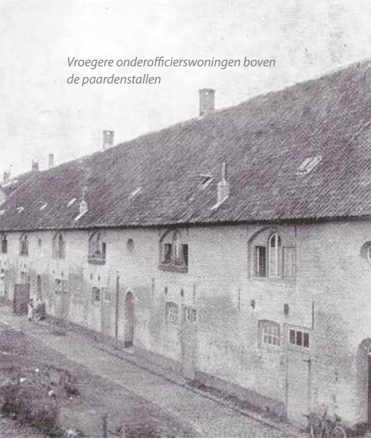
Vroegere onderofficierswoningen boven de paardenstallen