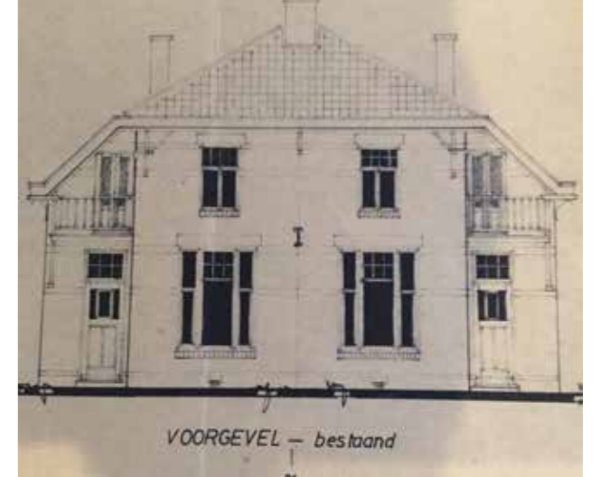
Vooraanzicht vóór de renovatie van 1980

Door toedoen van de vereniging Ons Belang worden er lokale bouwstichtingen opgericht (w.o. Harderwijk, Assen, Venlo en Amersfoort) om te zorgen dat de leden in kwalitatief goede en betaalbare woningen kunnen wonen en om te voorkomen dat de leden in minderwaardige buurten terecht komen. De eerste lokale vereniging die in dat kader wordt opgericht is de Onderofficiers Woningbouw-Vereeniging Harderwijk; opgericht op 9 juni 1910 en bij Koninklijk Besluit van 24 februari 1911, nummer 47 goedgekeurd. Het doel van deze vereniging is door eigen bouw te voorzien in de behoefte aan woningen voor in Harderwijk geplaatste onderofficieren. Grond om te bouwen is snel gevonden en op 12 november 1912 vond de aanbesteding plaats van 12 percelen, elk bestaande uit een dubbele woning, tezamen de Wilhelminalaan (totaal 24 woningen). Ze worden omschreven als landhuistype met een balkonnetje en veel houtwerk. Opmerkelijk is wel dat de woningen worden gebouwd met stenen die zijn afgekeurd bij de bouw van de Jan van Nassaukazerne aan de Stationslaan.