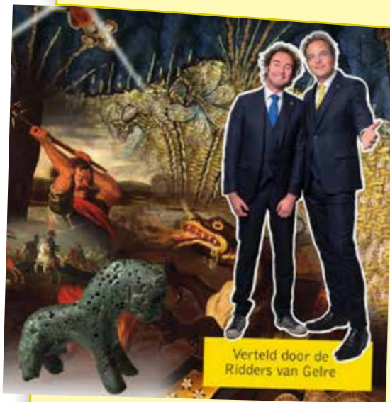
Verteld door de Ridder van Gelre

Het bestuur van deze stichting is druk doende om in de kelder onder restaurant IJsselmere (voorheen Papa Beer, hotel IJsselmeer) de archeologische opgravingen, zoals bijvoorbeeld de fundamenten van de Peelenpoort en schietgaten, zichtbaar te maken. Over niet al te lange tijd zijn al die archeologische vondsten te bekijken. De stadsgidsen kunnen je dan meenemen om ze te bewonderen.