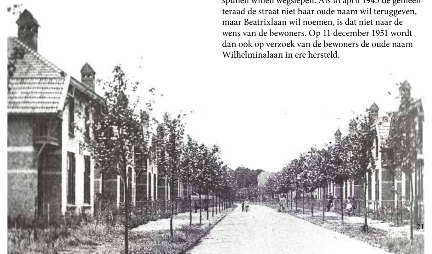
Wilhelminalaan omstreeks 1912

De woningen zijn zeer gewild, omdat ze voor hun tijd gerieflijk zijn ingericht, goed onderhouden en relatief goedkoop zijn. De huur is 14-16% van het bruto-inkomen.