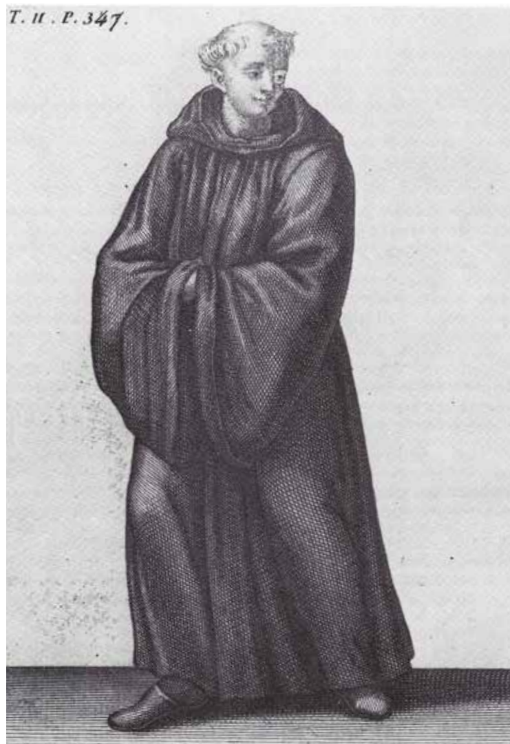
Broeder van het Gemene Leven

eigenlijk de voorlopers van wat we nu kennen als de lei en een krijtje. Papyrus of perkament worden nauwelijks gebruikt. Pas als ver in de 16 e eeuw de eerste lokale papiermolens worden gebouwd bij de sprengen op de Hoge Veluwe kan inheems papier worden gebruikt als schrijfmateriaal. Het letterschrift is eind van de middeleeuwen nog steeds het Gotische schrift, omdat dit minder ruimte in beslag neemt. Pas als het gebruik van papier eenmaal is ingeburgerd wordt overgegaan op het Latijnse schrift. Het lettertype dat de leerlingen moeten leren is niet het huidige (ronde) Latijnse lettertype. Om zoveel mogelijk letters op een regel te krijgen -perkament was duur -leren de leerlingen schrijven met het gebroken Gotische letterschrift.