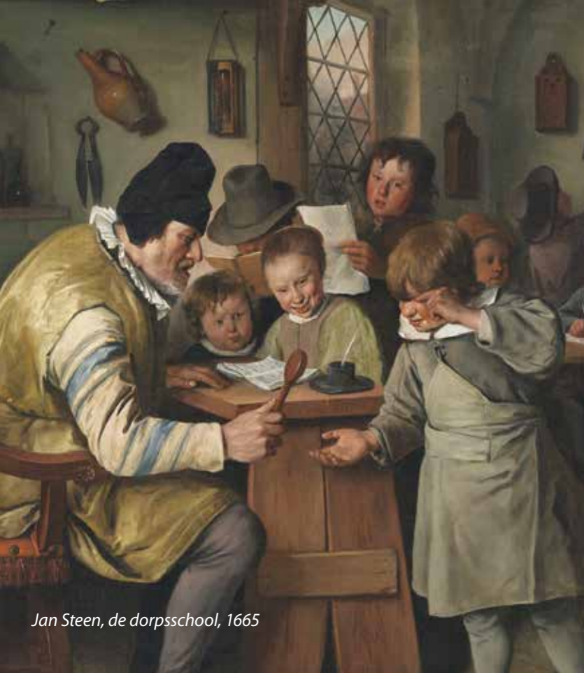
Jan Steen, de dorpschool, 1665