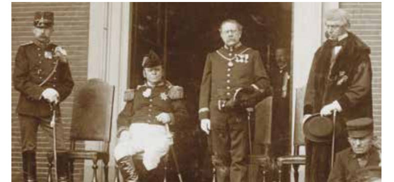
Onafhankelijkheidsfeest 1913, de viering van 100 jaar onafhankelijkheid van Nederland 1813-1913.