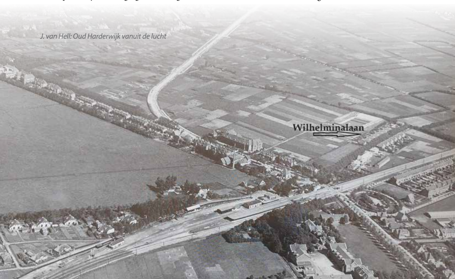
J. van Hell: Oud Harderwijk vanuit de lucht

Dankzij deze sponsors is het mogelijk een mooi blad uit te geven: