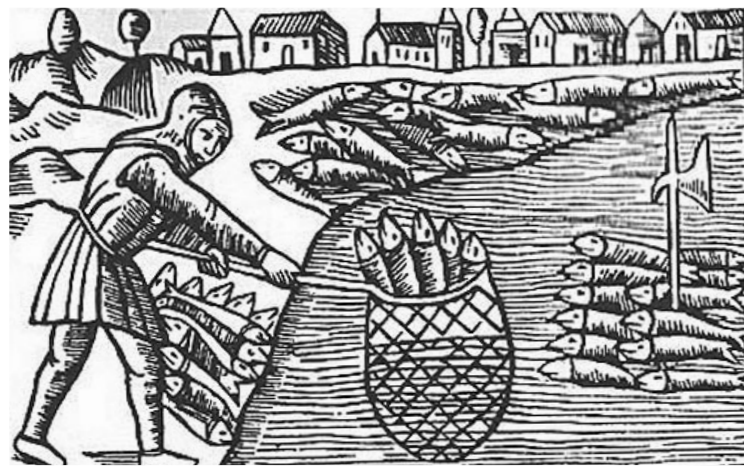
Haringvangst op Schonen [Wikimedia Commons]

De handel met het Rijnland groeit in de 13 e en 14 e eeuw gestaag. Met name bij de handel in vis treedt Harderwijk op de voorgrond. In Emmerich worden stadsbanken op de markt speciaal voor Harderwijker kooplieden bij hun komst vrijgemaakt. In Keulen hebben de Harderwijkers stapelrecht en stapelplicht van goederen. In 1360 worden ze van deze verplichting vrijgesteld. Ze mogen voortaan met schepen verder de Rijn opvaren. Bokking is een belangrijk Harderwijks exportproduct naar het Rijnland, naast landbouwproducten.