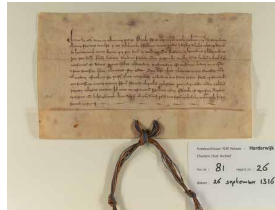
Oorkonde toewijzing vitte aan de stad Harderwijk, 1316 [SNWV, 5001 Stadsbestuur Harderwijk 1231-1813, inv.nr. 81]

De stadsbrand in 1503 vergroot de achteruitgang van handel en nijverheid. Harderwijk blijft wel lid van het Hanzeverbond. In 1615 is Harderwijk nog voor de dagvaart van de Hanze in Lübeck uitgenodigd. De achterstallige contributie van de stad bedraagt inmiddels honderden Rijnse guldens. In 1628 verschijnt Harderwijk niet meer op de dagvaart vanwege de hoge kosten en het geringe handelsvoordeel dat te behalen valt. In 1667 is de laatste landdag (jaarvergadering) van de Hanze gehouden. Twee jaar later wordt nog een poging gedaan de Hanze voort te zetten, maar de meningsverschillen zijn te groot om tot overeenstemming te komen. De Hanze bloedt dood.