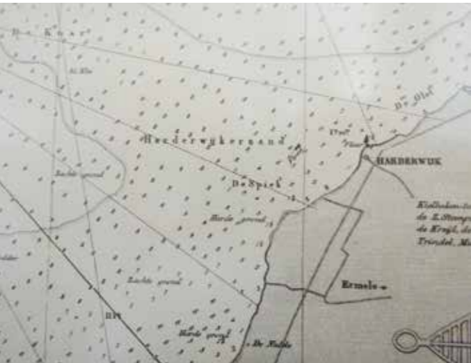
De Zuiderzee in 1852 voor Harderwijk met de Knar en de Harderwijker Bank. De dieptes worden vermeld in Amsterdamse voeten (1 voet = 28 cm)

Slechts in uitzonderlijke gevallen werd een wrak geconserveerd, meestal werd het weer aan de bodem toevertrouwd of uit elkaar getrokken en verbrand. Veelal waren de identiteit en de historie van een aangetroffen wrak onbekend en werd de vondst aangeduid met het kavelnummer waar het gevonden werd. In 1975 werd bij Zeewolde een wrak aangetroffen dat als 'QZ 18' de boeken in zou gaan. Het ging om een tjalk van bijna 20 meter lang en 5 meter breed. De vindplaats van het wrak was de Fabricageweg in Zee-