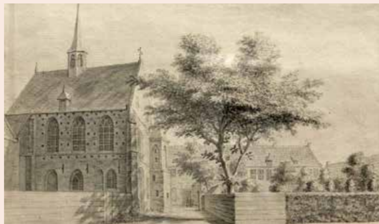
Academie van Harderwijk, met links de Catharinakapel. Tekening van A. Rademaker 1745.

“Ik ben begonnen met de vraag: wat is er eigenlijk bekend over de academie? Daar ben ik eens ingedoken en