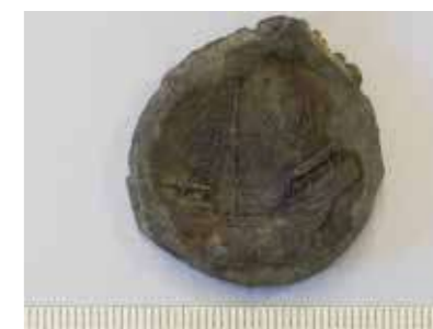
Lakenlood gevonden bij Hoge Brug, Harderwijk 2013, collectie Dielemans

Koningen en graven schenken aan de Hanze-kooplieden allerlei voorrechten. Soms worden deze handelsvoordelen ook door de Hanze met een oorlog afgedwongen. Voordelen die deze kooplieden verkrijgen zijn: tolprivileges, vrijstelling of vermindering van tolleren; vrijgeleide en bescherming van de graaf of koning in hun gebied en afspraken over eventueel geleden schade; een vaste plaats op de markten; afspraken over koopcontracten, betalingen en munteenheden en over speciale rechtspraak voor leden van de Hanze. Om zich tegen piraten en andere vijanden te beschermen varen de schepen van de Hanzekooplieden meestal in konvooi of reizen de kooplieden gezamenlijk over land.