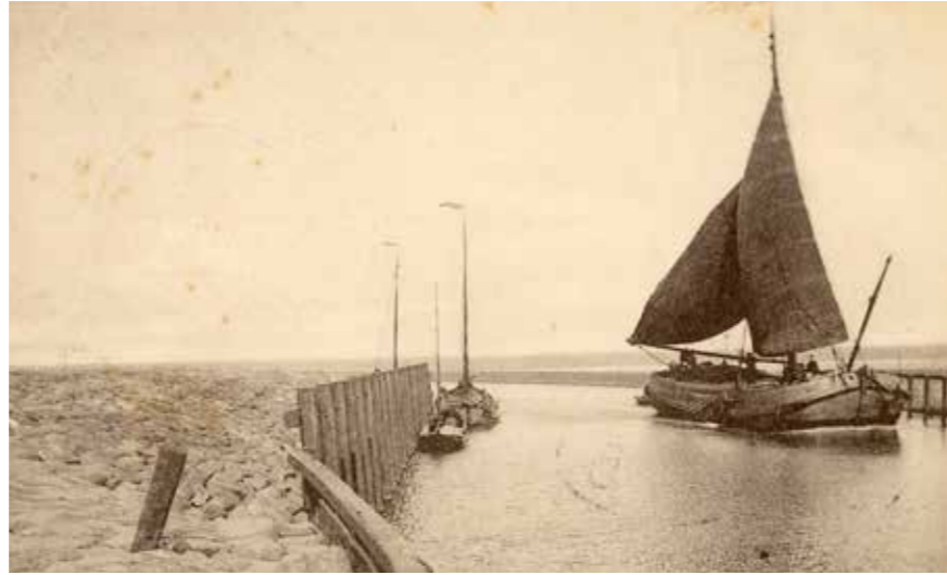
Een tjalk zeilt de haven van Harderwijk binnen. Het grootzeil is reeds gekat en gegeid en de bemanning staat klaar om de zeilen te strijken.