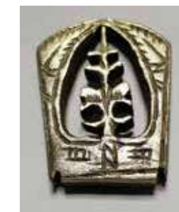
Heft van een mes. Circa 1500 (Collectie Ten Pierick)