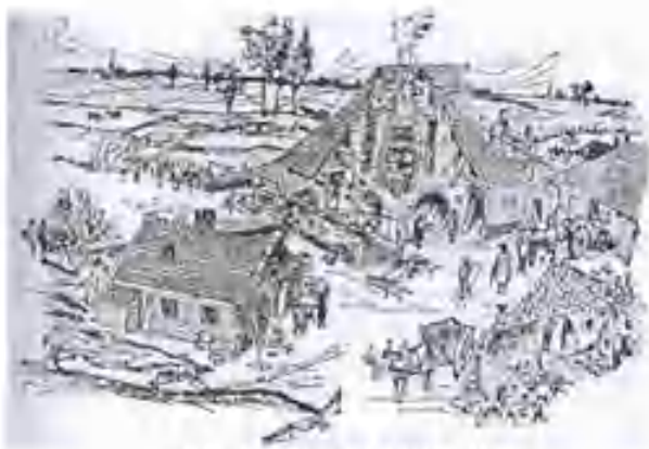
IJzersmelterij in de Achterhoek

Het middagprogramma bestond uit een excursie per bus langs de Oude IJssel, de bakermat van de Nederlandse ijzerindustrie. Langs de Oude IJssel werd voor het eerst in Nederland in hoogovens ijzererts gesmolten. De grondstof was het ter plaatse gedolven ijzer-oer (= gehydrateerd ijzeroxide, gevormd in drassige beekdalen). De oudste ijzergieterij dateert van 1689 en stond in Rekhem, bij Gaanderen.