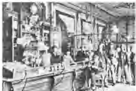
Cantine der kolonialen (uit: Harderwijk vertelt)

Is Oudejaarsdag 1999 de laatste dag van de 20e eeuw of beleven wij die dag pas op 31 december 2000? Daar wordt verschillend over gedacht, maar zeker is dat er over de datum 1 januari 2000 al heel wat pennen in beweging zijn gebracht. Er is ook al wel teruggeblikt op de (bijna) verstreken eeuw. In de krant van 1899 wordt er, behalve i.v.m. de begrotingen, nog weinig over het jaar 1900 geschreven. Wel wordt - enigszins vergelijkbaar met de computerproblemen van deze tijd - in een stukje over de Duitse posteries berichten, dat de poststempels ook in het nieuwe jaar alleen de cijfers van het jaar en niet het eeuwgetal te zien zullen geven. Na 99 voor 1899 komt dus 00 voor 1900. In Noord-Holland wordt in 1899, in een advertentie voor een te koop staande woning, gesteld dat de koopprijs uiterlijk 1 mei van de volgende eeuw moet zijn voldaan. (De verkoper bedoelde vermoedelijk 1 mei 1900. Indien de 20e eeuw pas op 1 januari 1901 zou beginnen, zou hij de opbrengst immers pas op 1 mei 1901 krijgen en dat was vast niet de bedoeling)