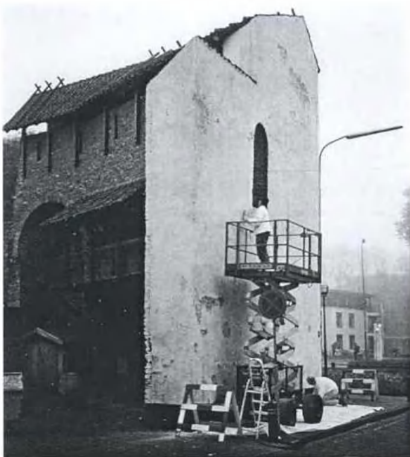
opknopbeurt in uitvoering

We zijn benieuwd naar het eindresultaat !