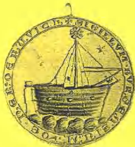
Zegel van de kooplieden van Harderwijk uit 1253. Randschrift: "sigillum burgensium de harderwiche"