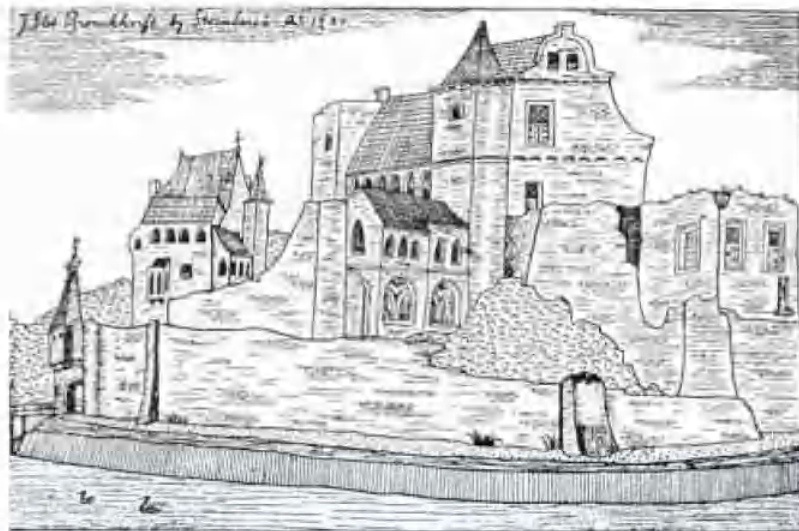
T Oude Casteel te Bronckhorts, naar ene oude teekening van C. Pronck 1730

Toen ik op zaterdag 9 juli - tijdens de geslaagde excursie naar Bredevoort en Bronkhorst - met mijn vrouw op de heuvel stond waar de burcht van de Heer van Bronkhorst had gestaan, realiseerde ik mij dat er twisten geweest waren tussen de Van Hekerens en de Van Bronkhorsten; verder ging mijn kennis niet. Thuis gekomen heb ik uitgezocht wat er destijds aan de hand was.