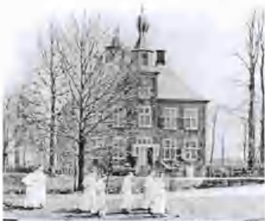
De Essenburgh

Enkele daarvan waren omvangrijke complexen: een statig buitenhuis met tuinen, parken en vijvers, tientallen boerderijen, bossen en woeste gronden. De meeste waren echter klein: niet meer dan een huis (vaak een verbouwde boerderij) met daaromheen een parkachtige omgeving. Veel van die landgoederen zijn verdwenen. Er resten soms niet meer dan enkele sporen in het landschap, die slechts op een kaart of luchtfoto zijn terug te vinden.