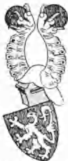
Wapen van het geslacht Bronkhorst

Voor alle adellijke heren gold dat het moeilijk voor hen was te leven van de opbrengst van hun grondbezit en uitbreiding was dus wenselijk. Op de achtergrond speelde de oorlog tussen Engeland en Frankrijk een belangrijke rol. Een aantal edelen hadden zich tegen behoorlijke vergoedingen verhuurd, hetzij aan Engeland, hetzij aan Frankrijk. De Van Hekerens wensten aansluiting bij Frankrijk terwijl de Van Bronkhorsten steun zochten in het Engelse kamp. Eleonora stuurde aan op actieve deelneming in de honderdjarige oorlog. Om deze reden kozen de grote steden van Gelre (Roermond, Zutphen, Arnhem en Nijmegen) voor de partij van de Van Hekerens, want zij waren meer gericht op een rustige ontwikkeling van het land zonder buitenlandse avonturen die veel geld kosten. Aanvankelijk hadden de Van Hekerens weinig succes; in 1361 werd Reinoud III in een gevecht gevangen genomen. Eduard dwong hem tot afstand en liet hem gevangen zetten in het kasteel Nijenbeek aan de IJssel. Eduard (1361-1371) streefde ernaar de verhouding met de grote steden te herstellen, hetgeen lukte want zij gaven hun verzet op. Vervolgens werd 10 jaar lang de strijdbijl tussen de Van Hekerens en de Van Bronkhorsten begraven.