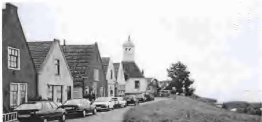
Durgerdam anno 1998