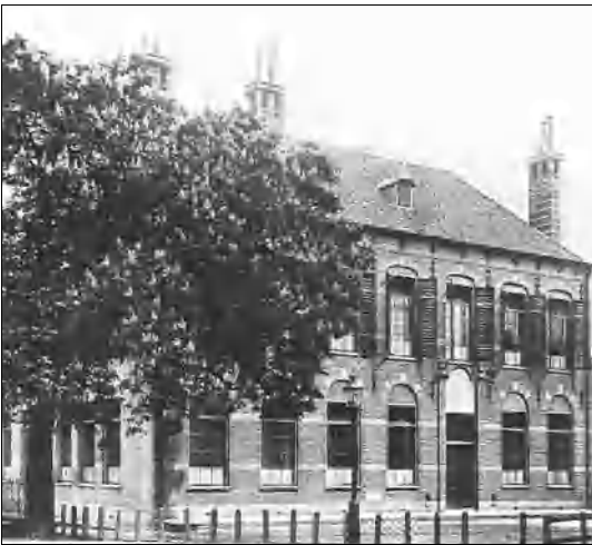
School B en C op het Kerkplein hoek Bongerdstee