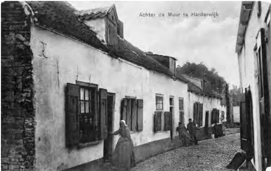
ansichtkaart uit de collectie van het gemeentearchief