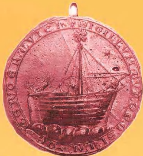
Zegel van de kooplieden van Harderwijk uit 1262 Randschrift: "sigillum burgensium de herderuvich"