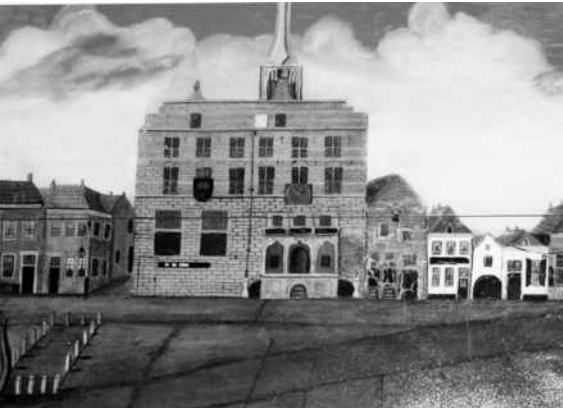
De Broederen met linksvoor “de paeltjes” en een glimp van de pomp