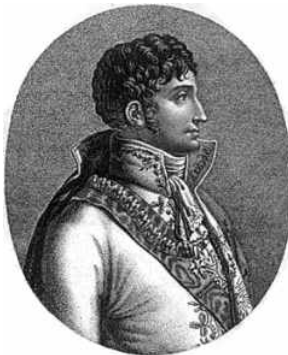
Koning Lodewijk Napoleon (1778-1846)