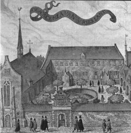
Universiteit in het voormalige kruisherenklooster te Franeker

den later geheel was opgeheven en ontbonden. Wel blonk, bij de heugelijke redding en herstelling onzes vaderlands in Slagtmaand 1813, de vernieuwde hope in het verschiet, dat de pas gestorvene na een kortstondigen doodslaap in het leven zou worden teruggeroepen, maar die hope werd niet vervuld. En inderdaad! Zooveel was, in den loop der tijden, in den toestand des vaderlands en de behoeften zijner bewoners gewijzigd, dat het bestaan van vijf universiteiten, alleen voor Noord-Nederland bestemd,