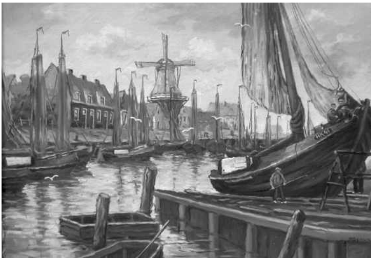
De HK 41 op de helling (schilderij)

Vervolgens: "23 juni, dit vaartuig is gesloopt. Met ijzer beslagen." Op 28 februari 1947 wordt het bewijs van inschrijving in het visserijregister ingetrokken.