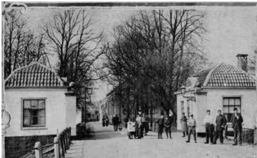
De 2 te slopen huisjes

Bij de Smeepoort staan een paar onooglijke huisjes. De gemeente heeft ze nog niet willen afbreken, maar de storm heeft hiermee al wel een flink begin gemaakt, zo is te lezen. Deze zaak komt daarna in de gemeenteraad aan de orde, als er een aanvraag wordt ingediend om deze twee huisjes te slopen. Dit gebeurt, waarna vaak wordt opgemerkt dat de omgeving er goed van opgeknapt is.