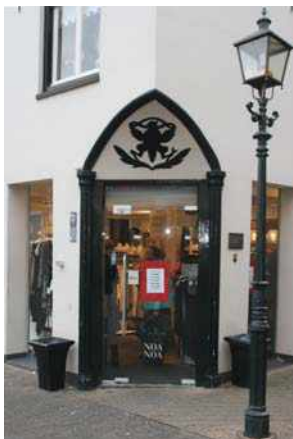
Entree huidige winkel (25-1-2008)

kwam vragen waarom dit symbool het hoekpand Bruggestraat, Markt opsierde. Hij had namelijk het symbool van zijn land herkend.