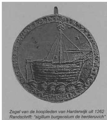
Zegel van de kooplieden van Harderwijk uit 1262. Randschrift: "sigillum burgensium de herderewich"