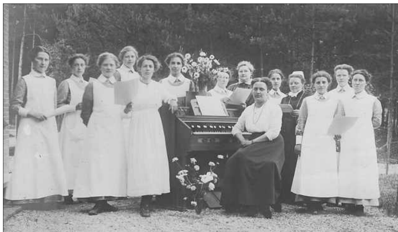
Medewerkers van de verpleging rond 1912

Er ontstonden plannen voor nieuwbouw en in 1973 werd het nieuwe verpleeghuis geopend. In eerste instantie bestond dat uit vier afdelingen voor somatische patiënten, met een capaciteit van 120 plaatsen. Het verpleeghuis was voorzien van de nieuwste snuffjes: zo kwam er een moderne afdeling fysiotherapie met een oefenzaal en een modern vlinderbad. Het ziekenhuis en het verpleeghuis waren instellingen die waren voortgekomen uit het oude Sonnevandk. Sonnevandk bleef een bijzondere gemeenschap. Veel medewerkers woonden in de buurt van het sanatorium en ze hadden veel gemeenschappelijk. Verjaardagen vierde men samen en men deelde lief en leed. Het had te maken met de ligging, zo'n vijf kilometer buiten de stad, waardoor men vaak op elkaar was aangewezen en het had ook te maken met het gemeenschappelijke ideaal waarvoor men naar Harderwijk was gekomen.