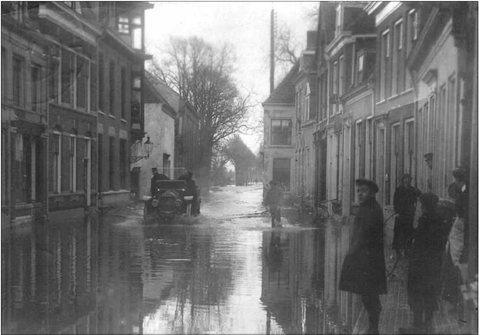
Grote delen van Harderwijk liepen onder water. De foto boven toont een kijkje vanuit de Smeepoortstraat naar de Stationslaan.

Op 13 en 14 januari 1916 voltrok zich in Nederland een watersnood rond de Zuiderzee. Een stormvloed viel samen met een hoge afvoer op de rivieren. Als gevolg braken op tientallen plaatsen de dijken en was daarnaast op veel plaatsen sprake van schade aan binnenbehoor en bekleding van de dijken. De watersnood maakt veel dodelijke slachtoffers en de materiële schade was enorm.