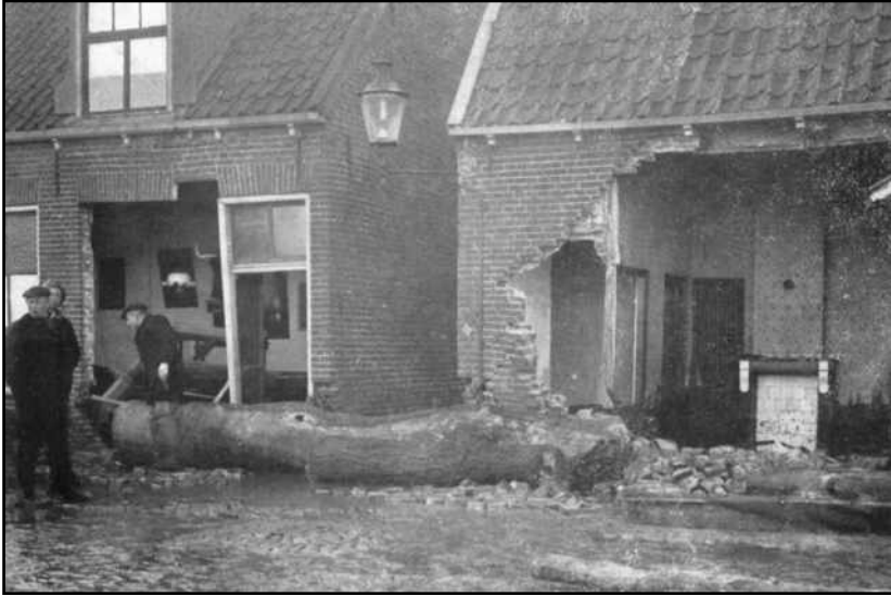
Kapotgeslagen huisjes op de Havendam