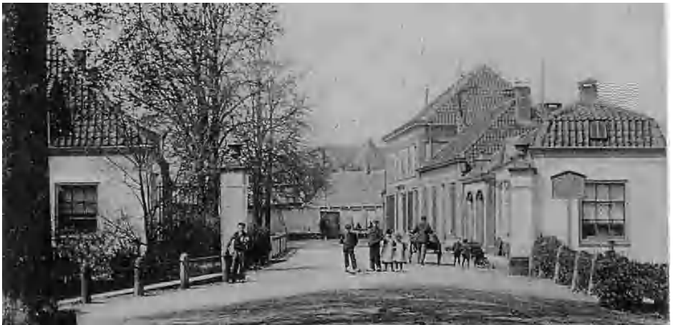
De Luttekepoort in vroegere tijden

een drukte van belang en menige Harderwijker toog naar huis om er met de digitale camera plaatjes van te maken. Het kijkje in het verleden duurde maar enkele dagen want om de doorstroming niet te lang te stagneren werd de opbreking snel gedicht. Inmiddels raast het snelverkeer weer langs de Luttekepoort richting Vitringasingel en is er van al dat unieke materiaal niets meer te zien. Goed om te zien dat er veel belangstelling is in onze lokale geschiedenis. Voor wie het heeft gemist hier nog een foto en een foto uit de 'oude doos' van de voormalige Luttekepoort.