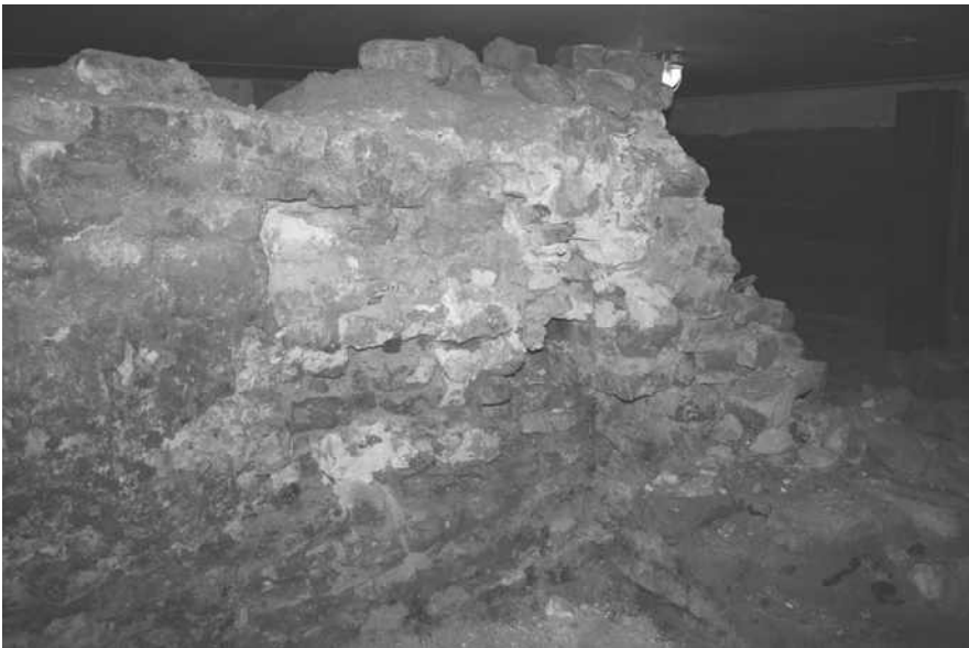
De illustraties zijn foto's van het fundament onder het pand van Krijco in de Bruggestraat. De foto op pagina 30 geeft een doorsnede van de muur, pagina 32 geeft een overzicht van de kelder en hierboven een detail van het fundament.

De gedachten gaan dan uit naar een relatie met bijvoorbeeld een klooster, het achtergelegen gasthuis of een blokhuis van de landsheer. Uit de bronnen is bekend dat er meer belangrijke gebouwen buiten de stad lagen. Buiten de Luttekepoort lag de Selhorst, een uithof van het Utrechtse Kapittel van St. Marie en in 1305 is er een vermelding van een blokhuis, mogelijk ter hoogte van de gelijknamige straat aan de zuid westelijke rand van de huidige binnenstad. Hoewel hypothetisch sluit deze vermelding een dergelijke functie voor het onderzochte huis aan de Bruggestraat niet op voorhand uit. Het huis ligt in de directe nabijheid van de Bruggepoort die toegang gaf tot het havengebied. Wanneer in 1315 de stad naar het zuiden wordt uitgebreid is het denkbaar dat er aan de rand van dit nieuwe stadsdeel een nieuw blokhuis gebouwd wordt en dat het oude een andere functie krijgt.