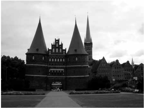
Stadspoort van Lübeck

Omstreeks 1160 werd Lübeck gesticht. Deze stad werd de eerste schakel in een lange rij handelssteden, langs de Oostzeekust gelegen, zoals Wismar, Stralsund en Greifswald, van waaruit Duitse kooplieden met tomeloze energie opereerden. Nog voor het midden van de 13 e eeuw waren deze erin