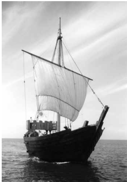
De Kamper Kogge, een replica van een middeleeuws Koggeschip

De intensivering van de handel in het Oostzeegebied heeft voor West-Europa grote gevolgen gehad. Tussen oost en west vond weldra een zeer levendige ruil van goederen plaats. Eerst maakte deze handel gebruik van de landweg tussen Hamburg en Lübeck maar in de 13 e eeuw kozen de kooplieders met hun koggen (een groot en stabiel scheepstype, dat ongeveer 30 meter lang en 4 meter breed was) meer en meer de directe weg om Kaap Skagen, de noordpunt van Denemarken, teneinde van de Noordzee (toen nog Westzee geheten) in de Oostzee te komen en omgekeerd.