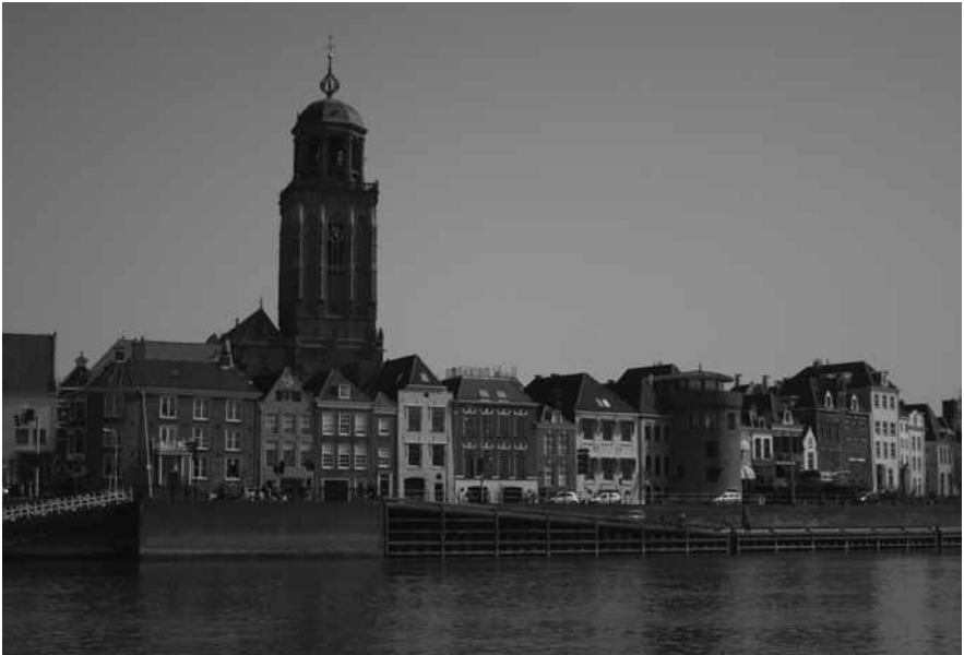
De grandeur van deze Hanzestad is te zien aan de statige huizen aan de IJssel

De belangrijkste onder de vijf genoemde steden was de oude IJsselstad Deventer, in het toenmalige Oversticht Utrecht, de huidige provincie Overijssel. Al in de tijd van Karel de Grote wordt er over de “portus Daventre” gesproken als van een plaats van koophandel. Later brachten de burgers van Deventer de uitgebreide handel te water en te land tot stand met het Rijnland en de naburige Westfaals-Nedersaksische gebieden, met de Oostzee, naar Bergen, naar Holland, Vlaanderen en Engeland. Later werd Deventer in deze internationale handel overvleugeld door Kampen. Toch was de positie van Deventer als stad van de jaarmarkten onbetwist. Bij deze jaarmarkten, die viermaal, later vijfmaal per jaar werden gehouden, stroomden de kooplieden uit de verre streken van Noord- en Oostzee tezamen.