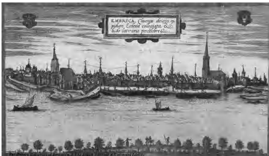
Een gravure van Emmerich, in welke stad Harderwijkers grote privileges genoten