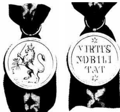
Voor en achterzijde van de onderscheiding Orde van de Nederlandse Leeuw

Voor Extract conform: Haberling Secretaris